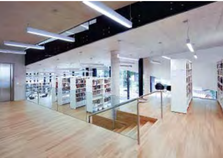
I dislivelli creano interessanti spazi che, inondati di luce, offrono postazioni individuali per leggere e lavorare.