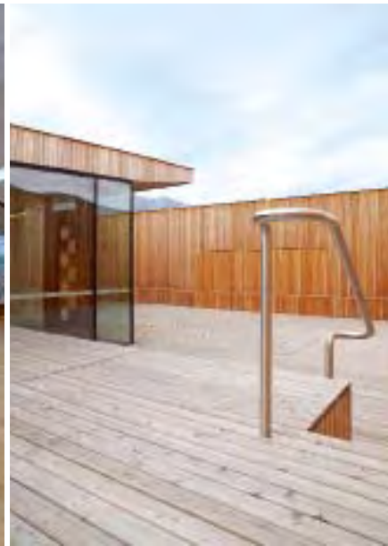
La terrazza sul tetto: in parte protetta e in parte con vista panoramica.