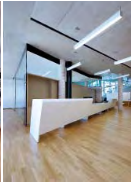
Il bancone dalla forma irregolare è il pezzo d'arredamento più vistoso e il cuore della biblioteca.